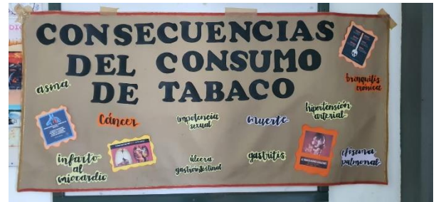
Elaborado por alumnos de la facultad.

Este año se reacreditará a la Universidad como "Espacio libre de Humo y Emisiones", por lo que la comunidad trabajará de forma activa a través de las campañas, y para muestra basta un botón.