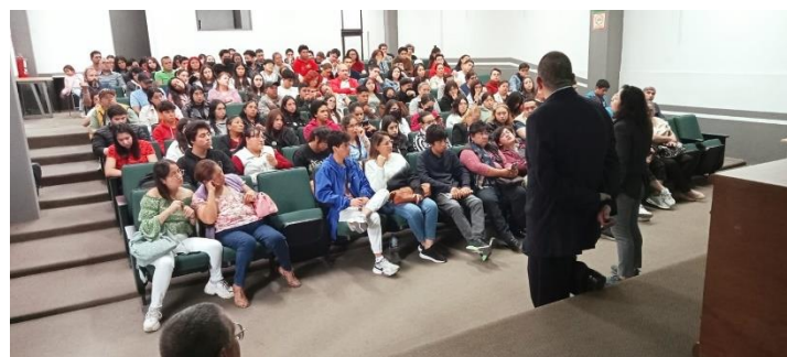
Licenciatura en Ingeniería Química.