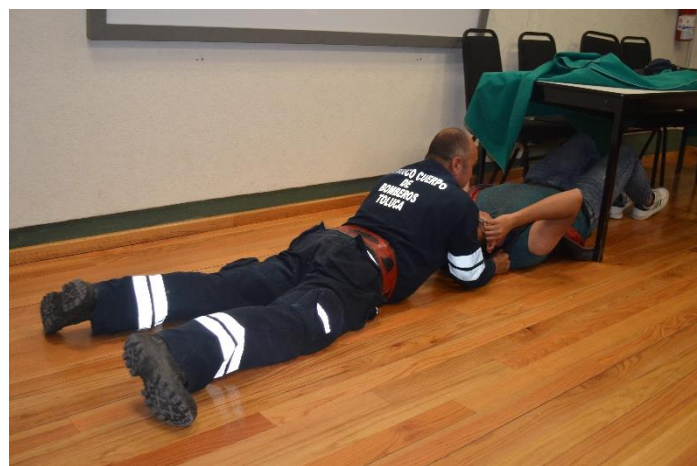
De la misma manera se realizó el curso sobre búsqueda y rescate, motivando a los alumnos a integrarse a las brigadas de seguridad en la Facultad de Química.