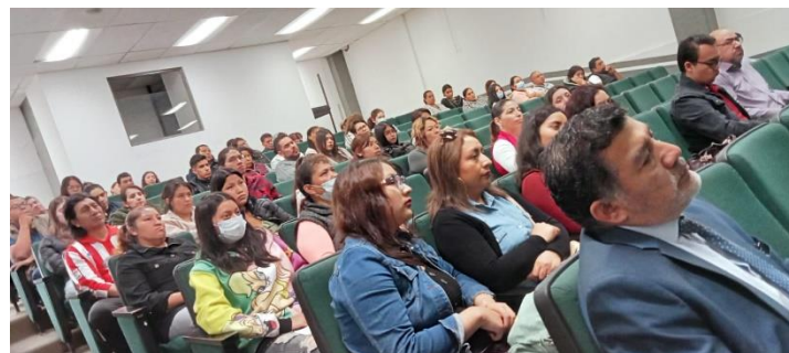
Licenciatura en Química en Alimentos.

Como cada año se reciben nuevos aspirantes en los diferentes planes de estudio, se llevaron a cabo los cursos de inducción.