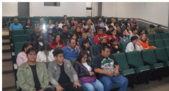
Licenciatura en Química.