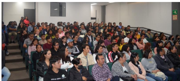
Licenciatura en Química Farmacéutica Bióloga.